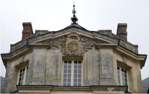
Le fronton central (façade sud)