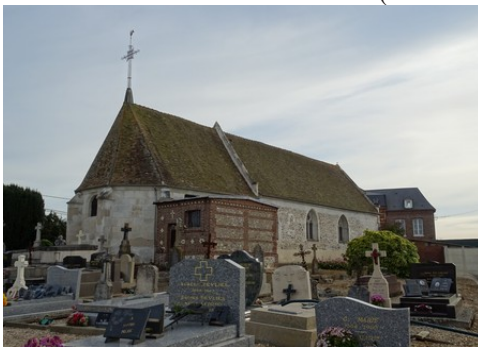
L'église du Tremblay Omonville

Les avis seront cohérents avec ceux émis ces dernières années, à savoir : pas de maisons à volume compliqué (type V, W, Y, ou Z), Rez-de-chaussée + Combles, pentes à 45° pour les volumes principaux, ardoise ou tuile plate de teinte brun vieilli, à 20u/m 2 , avec un débord de toiture de 20cm, enduit de teinte beige clair avec modénatures (au choix : chaînages, encadrement de fenêtres, soubassement, colombage...). *Voir autres fiches.