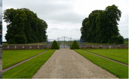
La perspective vers le sud