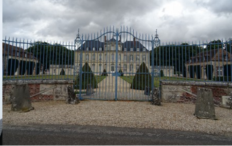
Les grilles d'accès au château, au sud