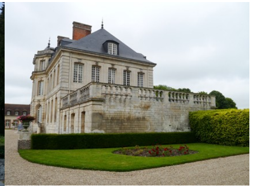
L'aile basse est, abritant les communs