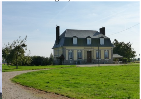
Une maison aux abords