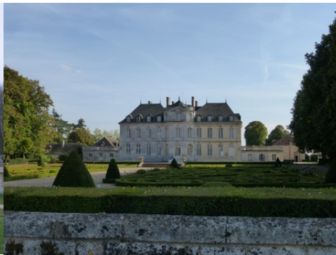
Les parterres et la façade nord