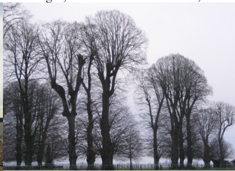
Les alignements et bosquets d'arbres