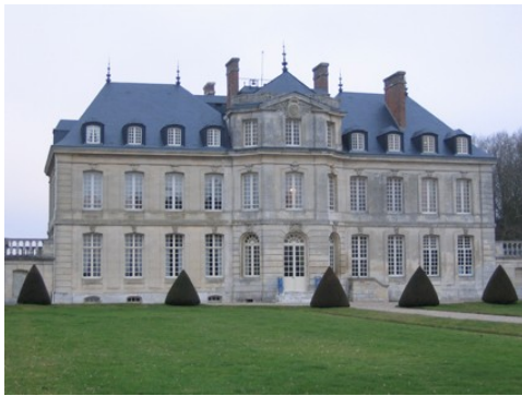
La façade sud du château